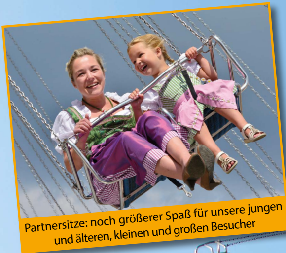
Partnersitze: noch größerer Spaß für unsere jungen und älteren, kleinen und großen Besucher