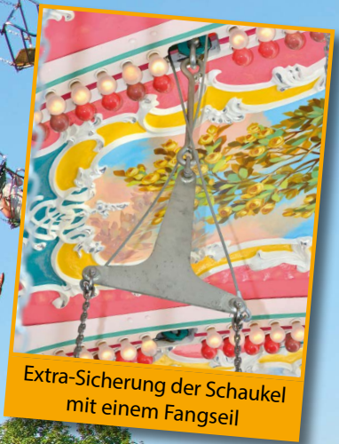
Extra-Sicherung der Schaukel mit einem Fangseil