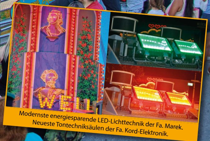
Modernste energiesparende LED-Lichttechnik der Fa. Marek. Neueste Tontechniksäulen der Fa. Kord-Elektronik.