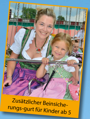
Zusätzlicher Beinsicherungs-gurt für Kinder ab 5