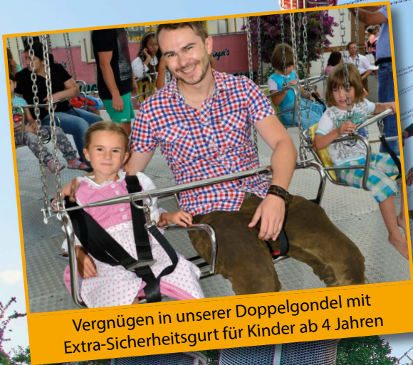
Vergnügen in unserer Doppelgondel mit Extra-Sicherheitsgurt für Kinder ab 4 Jahren