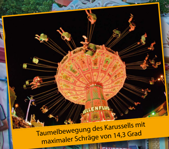
Taumbewegung des Karussells mit maximaler Schräge von 14,3 Grad